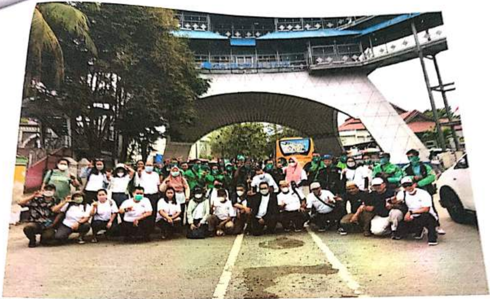
Kunjungan Lapangan Pada FKL-4