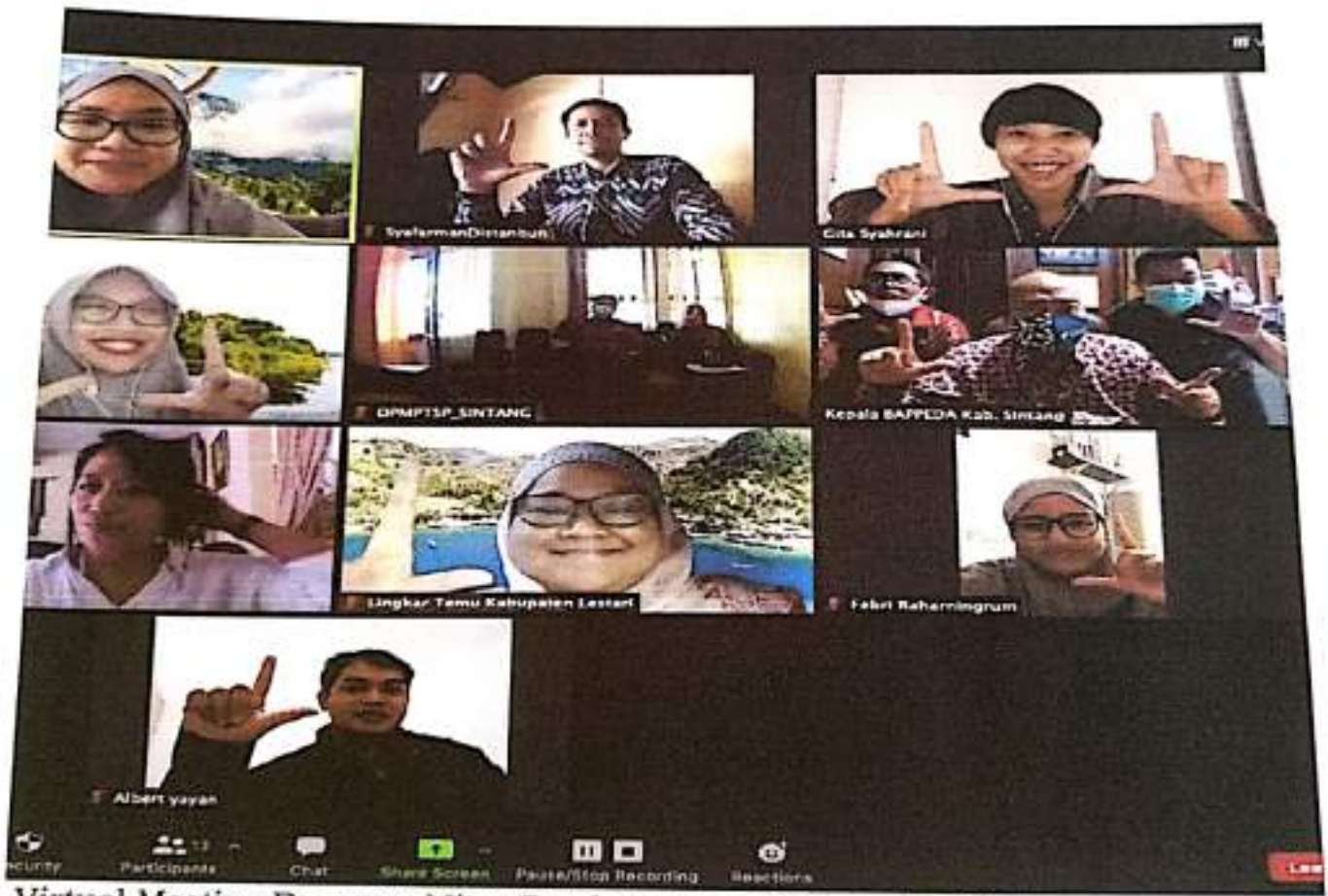
Virtual Meeting Bersama Mitra Pembangunan Kabupaten Sintang