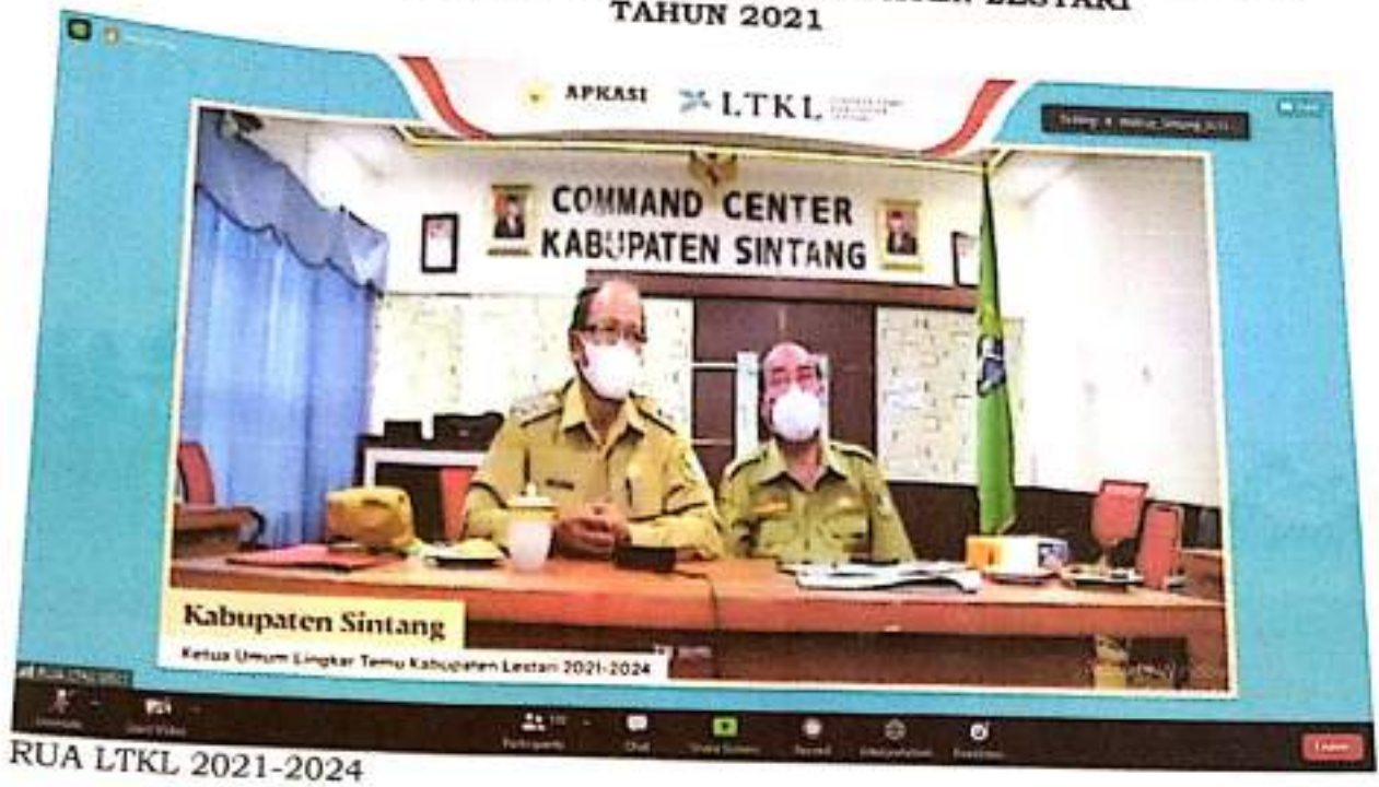
FOTO KEGIATAN FASILITASI DAN KOORDINASI BERSAMA MITRA DAN KEGIATAN LINGKAR TEMU KABUPATEN LESTARI TAHUN 2021