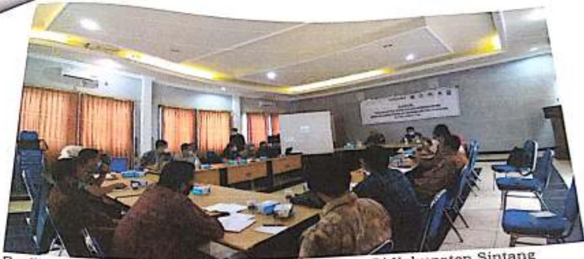
Fasilitasi Pertemuan Dengan Mitra Pembangunan Di Kabupaten Sintang