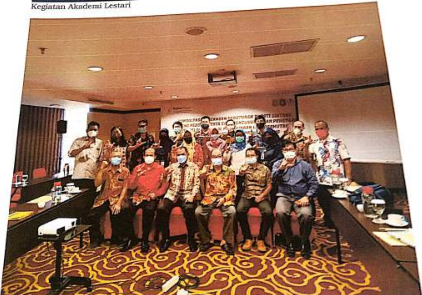
Rapat Pembahasan Draft Peraturan Bupati Tentang Tata Cara Pengelolaan Area Berhutan Di Luar Kawasan Di Kabupaten Sintang